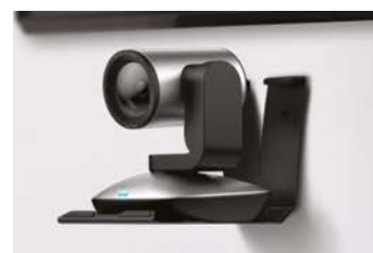
Montert på vegg

Du kan kople til enda enklere. Opprett forbindelse mellom NFC-aktiverte mobilenheter og CC3000e, ved å holde dem mot hverandre. Uansett om brukeren kople til med Bluetooth ® eller NFC, er CC3000e programmert til å huske kun den siste mobilenheten som ble koplet til, for trygghet og bekvemmelighet.