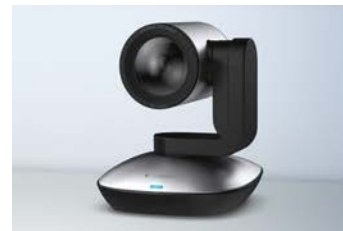
Stående på bord eller hylle