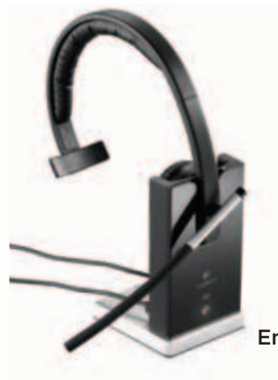
Enkel (i dokk)