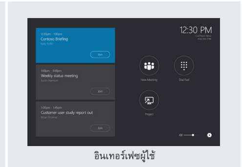
อินเทอร์เน็ตผู้ใช้