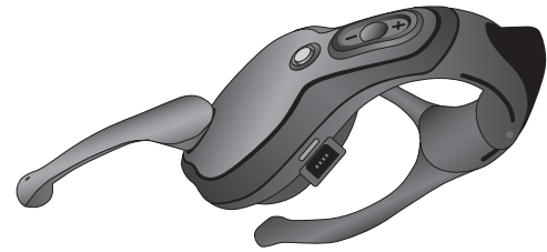
Logitech® Cordless Headset for Xbox® Quick Start Guide Casque Sans Fil Pour Xbox® Guide de démarrage rapide