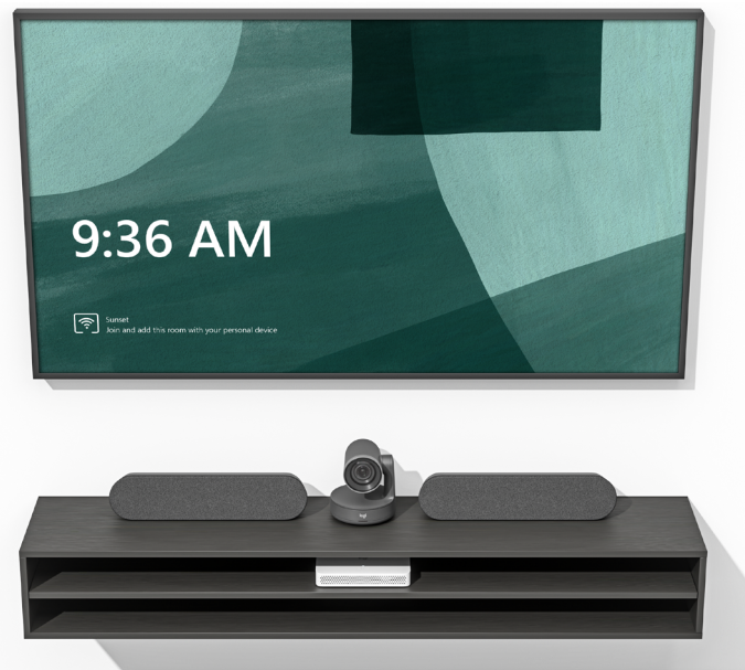
Logitech RoomMate mit Rally Plus-System