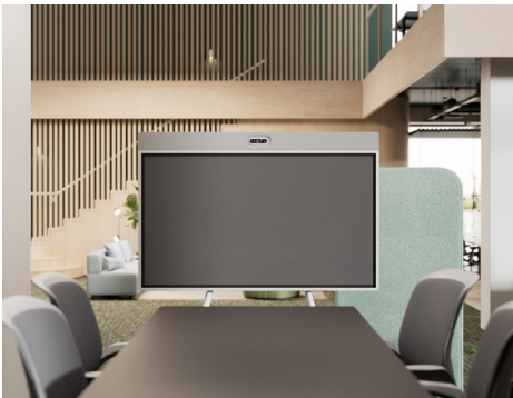
Carro con cámara encima