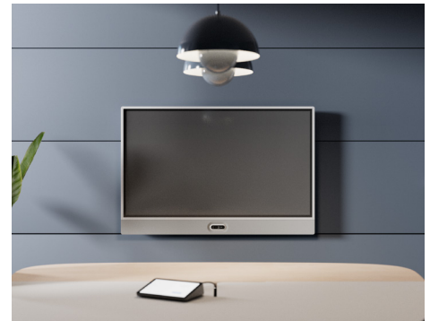
Soporte de pared con cámara debajo

Diseñada para ofrecer flexibilidad, la solución Rally Board 65 está pensada para su forma de reunirse. Funciona a la perfección con las principales plataformas, como Microsoft Teams, Zoom y Google Meet* en modo Android, PC o BYOD, para que pueda adaptar fácilmente Rally Board 65 a las necesidades actuales y futuras. Además, ofrece opciones de soporte múltiple**, para que pueda usarla en cualquier espacio abierto o sala de reunión. Su diseño permite colocar la cámara encima o debajo de la pantalla, de forma que todos los participantes mantengan un contacto visual natural en todos los espacios.