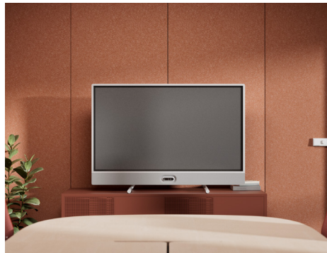
Soporte de mesa con cámara debajo