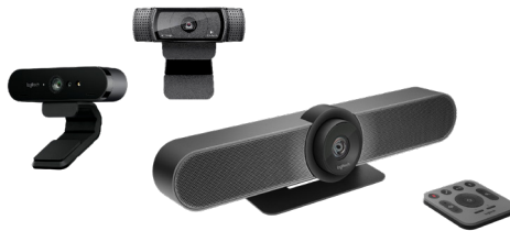
Collaboration vidéo Logitech

Étendez et améliorez les services de santé avec des interactions vidéos en face à face. Configurez une clinique virtuelle, soutenez la formation médicale continue, hébergez les réunions du conseil d'administration, ou dispensez des consultations spécialisées grâce aux solutions collaboratives simples d'utilisation de Logitech.