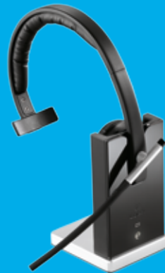
MONO (EN BASE)